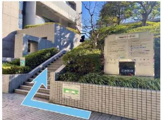
⑦右手に見える階段を上がります。