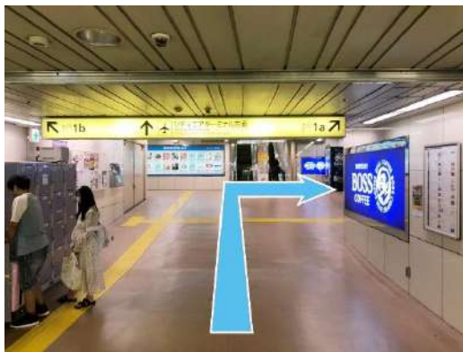
③出口1aの階段を上る。