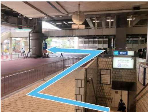
④出口階段を上って振り返ると見える道路（水天宮通り）を左へ。