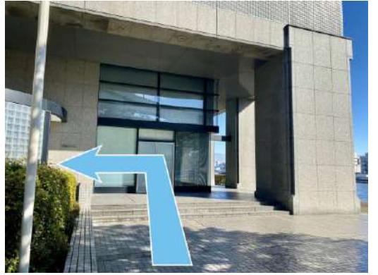
⑧階段を上りきったらすぐ左へ直進。 つきあたりを左へ曲がると、入り口があります。