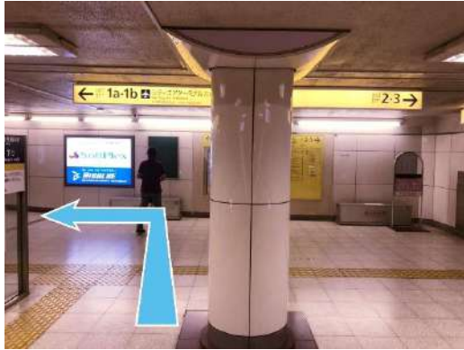
②階段を上りきったつきあたりを左へ。