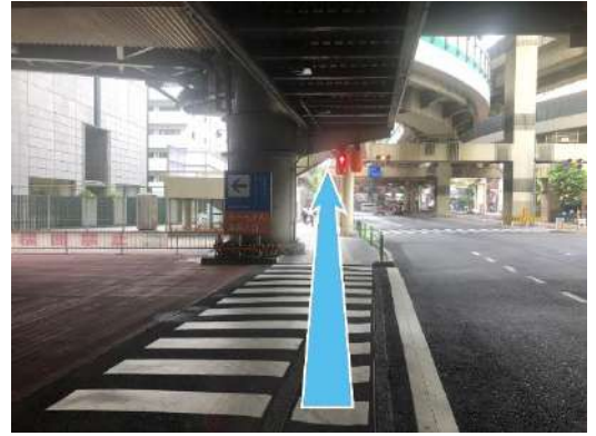
⑤首都高速に沿って側道を直進。